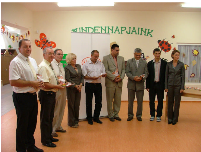
A Henkel vezetői a települések polgármestereivel

kaphassanak a hirtelen kialakuló, életet veszélyeztető balesetekről és gyermekbetegségekről, valamint azok kezelési módjáról.