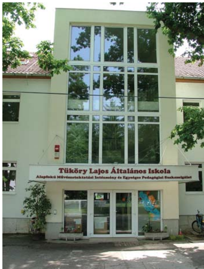
A megújult „gimnázium”