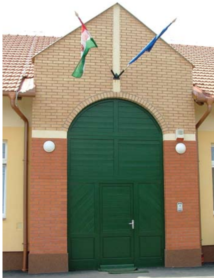
A Zöldág Bölcsőde és Óvoda